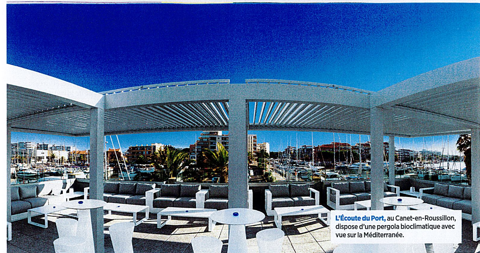
L'Écoute du Port , au Canet-en-Roussillon, dispose d'une pergola bioclimatique avec vue sur la Méditerranée.