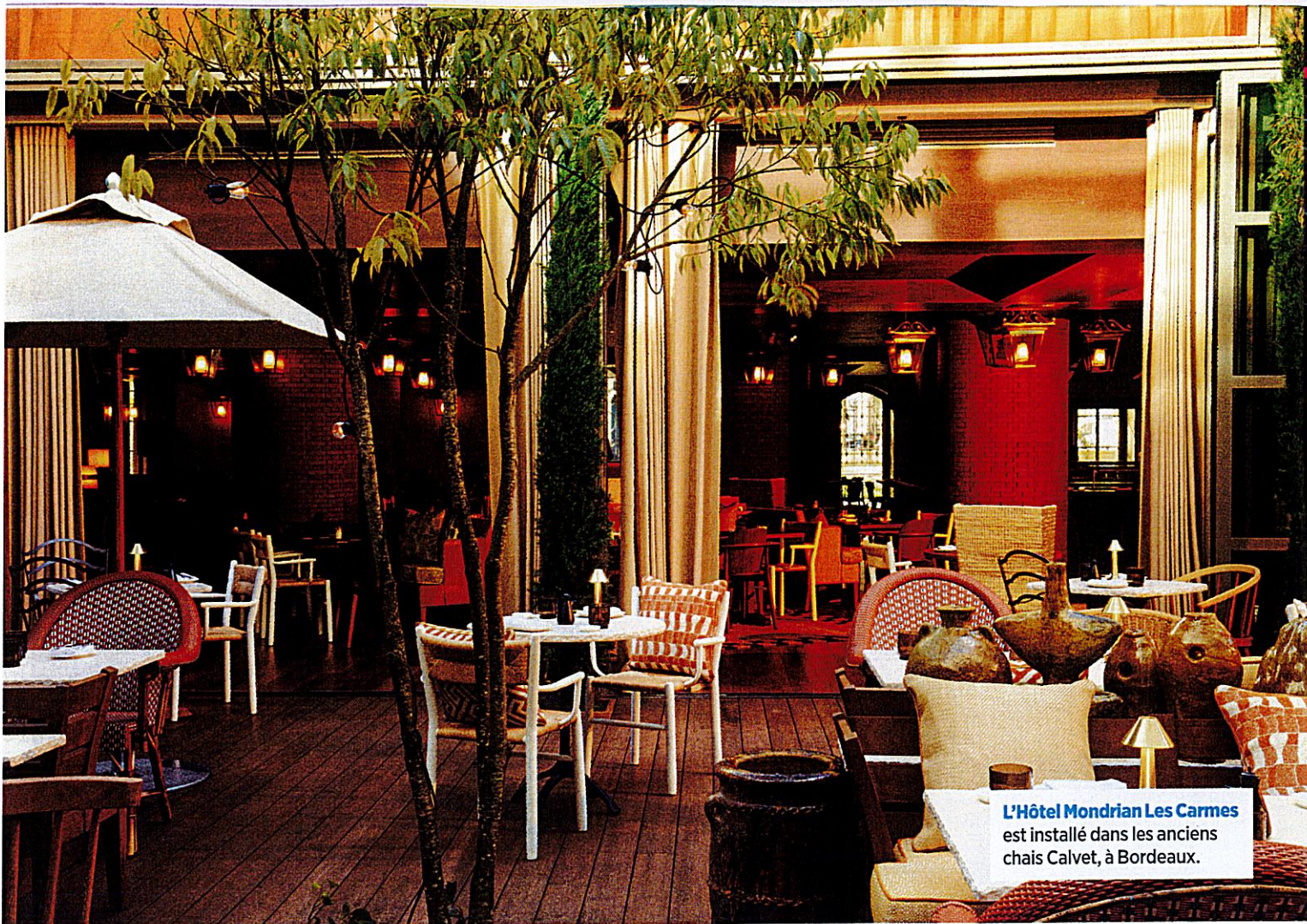
L'Hôtel Mondrian Les Carmes est installé dans les anciens chais Calvet, à Bordeaux.